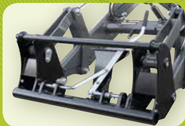
7 Enganche automático de implemento EURO