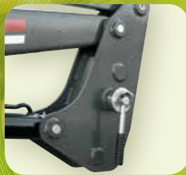
2 Enganche automático tractor-pala