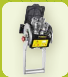
3 Placa multienchufes FASTER (de serie)