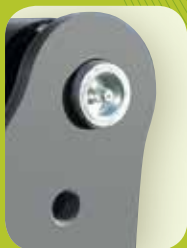
6 CÓMODO ACCESO DE MANTENIMIENTO