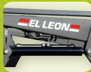
4 Cilindros de doble efecto