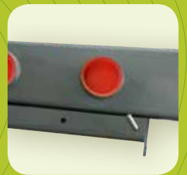
5 Patas integradas en brazo