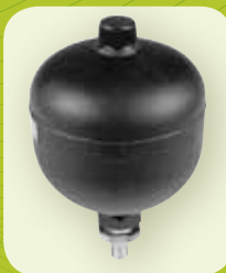
8 Amortiguador (opcional)