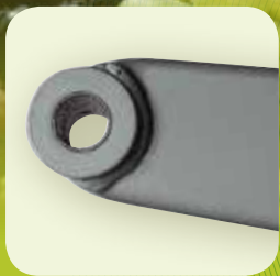
1 Articulaciones encasquilladas